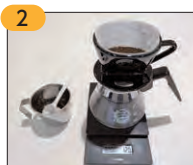
2 はかりに器具を載せたら、重さを0にリセットして、コーヒー1杯分12gの粉を量り入れます