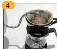
4 ドリップの際、外側にはお湯をかけなくてOK。お湯は内側から自然と外側に広がります