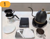
1 ドリッパー、コーヒーサーバー、はかり、ケトル、ペーパーフィルター、粉を用意

お湯を注ぎます。1投目のドリップは中心から1円玉サイズの円を描くように80ccをゆっくりと。一定の速さでお湯が途切れないように注ぐのがポイントです。液面が落ち着いたら2投目40ccを1投目と同じように注ぎます。液面が少しへこんだら仕上げの3投目です。20ccを同様に注いで、コーヒーがサーバーに落ち切るまで待ちます。この手順で淹れて、味が軽いと感じたら注ぐスピードが速い、渋味が出ているなら注ぐスピードが遅いのかもしれません。お好みの味に調節してください。