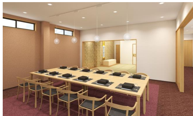
エテルノ鳴尾武庫川 会食室イメージ