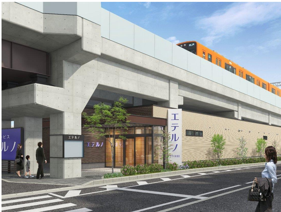
エテルノ鳴尾武庫川 外観イメージ