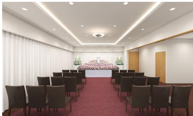
エテルノ鳴尾武庫川 式場イメージ